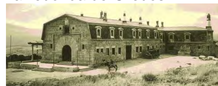
El Parador en 1928

El Parador de Gredos es el primero de los Paradores de Turismo, inaugurado en 1928 y que permanece operativo desde entonces. Se encuentra ubicado en la Sierra de Gredos (en el Alto del Risquillo) en el municipio de Navarredonda de Gredos.