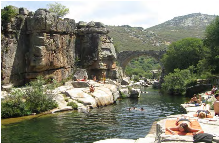
Pozo de las Paredes