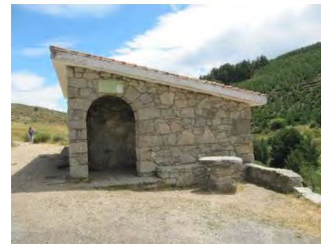
Molino de los Navajeros

Pasaremos por la zona recreativa de El Puente del Duque. Es una tranquila zona de recreo y baño en las tranquilas aguas del Tormes, donde hay además un Camping.