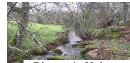
Rivera de Malcata

Caminaremos un pequeño trayecto por carretera hacia una de las barriadas a las afueras de Sabugal (1 km. ) para coger el GR 22 (Ruta de las Aldeas Históricas de Portugal) en dirección a la pequeña aldea de Urgueira, por donde atraviesa dicha ruta. Tras caminar unos 6 km., cruzaremos al otro lado de la carretera para continuar otros 9 km. por un camino entre pinarres, barruecos y un parque eólico, hasta llegar a Sortelha, coqueta Aldea Histórica medieval, de gran interés arquitectónico, histórico y paisajístico, donde finalizaremos la ruta.