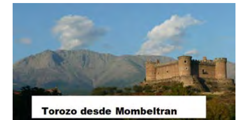
Toroza desde Mombeltran

El último sábado de junio habitualmente hay un paso de ganado reviviendo de la trashumancia. El paso de las vacas del Marqués de Valduenza desde Alburquerque en Extremadura hasta la finca Villagarcía en Muñana (Avila), con perdonalidades invitadas, es además un acontecimiento social.