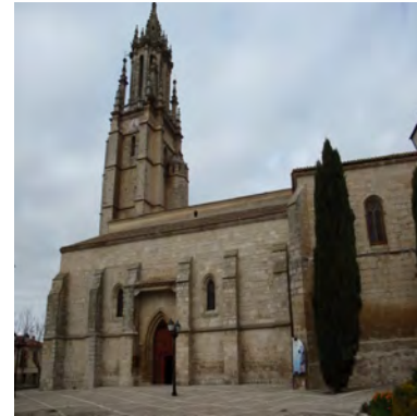
COLEGIATA DE SAN MIGUEL

re fue llamada “la Giralda” de tierra de Campos.