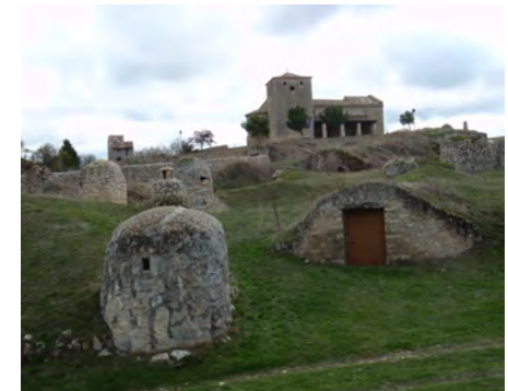
CHIMENEAS DE LAS BODEGAS CON IGLESIA AL FONDO

Pequeña población distante de Ampudia dos km. Está asentada en la ladera septentrional de los montes de Torozos. Destaca en ella su iglesia de estilo románico de una sola nave. Data del S. XII o XIII aunque posiblemente asentada sobre otra anterior prerrománica del S. X.