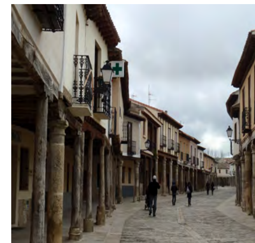
CALLE TÍPICA DE AMPUDIA

que la localidad propiamente fue fundada por los conquistadores romanos hacia el siglo II o I a. c. dándole el nombre de Fons Putida.