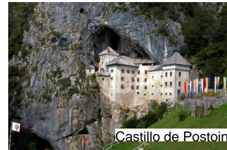
Castillo de Postojna

Postojna Con 20 km. de pasillos, galerías, salas, estalagmitas y estalactitas,... es la más grande y visitada de Europa. Parte de la visita se realiza en tren y otra a pie, cuya duración es de 80-90 minutos, ya que no se visita toda la gruta. Se puede visitar también el castillo, que fue construido en un acantilado.