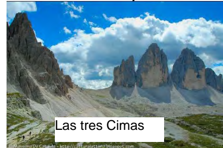
Las tres Cimas

2.- El conjunto más espectacular y más fotografiado de Dolomitas es sin duda el formado por Las Tres Cimas del Lavaredo . Nuestra marcha discurrirá alrededor de ellas, partiendo del Refugio Auronzo, para ver de ese modo todas las perspectivas de este bello conjunto.