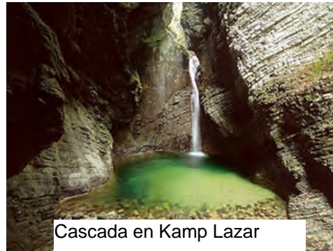
Cascada en Kamp Lazar

Este martes saldremos de Ljubljana, y haremos una marcha por los verdes campos de Eslovenia. Uno de los sitios de veraneo típico en ese país, Kamp Lazar, junto al río Soca, con algún pueblo típico y alguna cascada.