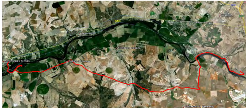
RUTA: EDAR-PINO DE TORMES-ALMENARA