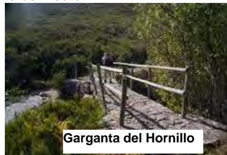
Garganta del Hornillo

Comenzamos el descenso que nos llevará en primer lugar a la Garganta del Hornillo y luego a la Garganta del Yedrón.