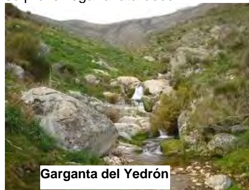
Garganta del Yedrón

Desde la garganta continuamos faldeando la ladera hasta encontrarnos con un bosque de castaños, que se hará más bonito con luz de tarde, pues se prevé llegar al atardecer.