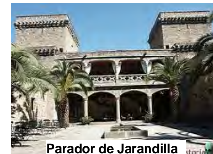
Parador de Jarandilla

Ya la ruta cruza la carretera que une Guijo de Santa Bárbara y Jarandilla, subiendo unos metros por la carretera retomamos el camino que nos conduce definitivamente y tras cerca de 9 horas hasta Jarandilla de la Vera