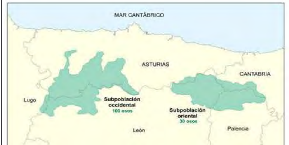
POBLACIONES DE OSOS PARDOS EN LA CORDILLERA CANTÁBRICA