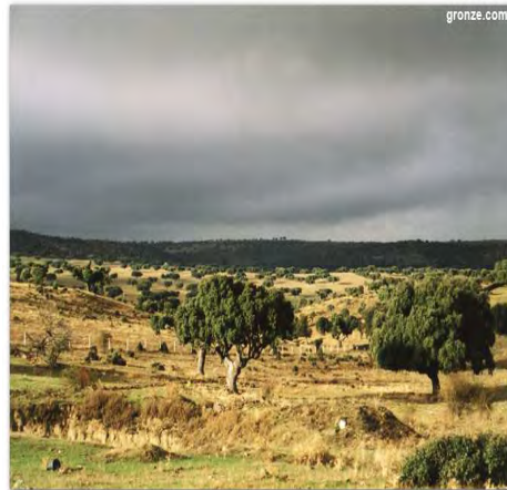
Dehesas de Encinas

El término “dehesa” etimológicamente puede hacer referencia a “defensa”, suele asociarse a grandes latifundios de origen y uso ganadero.