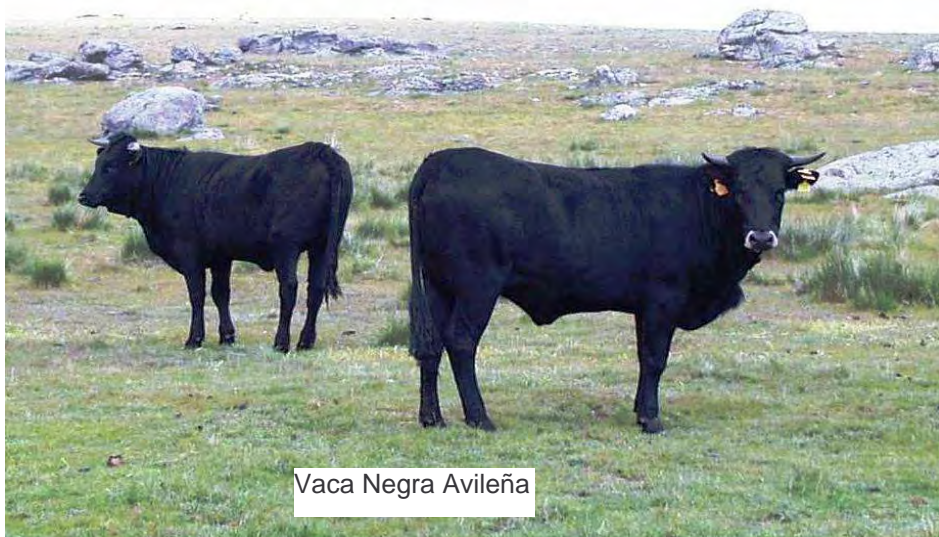
Vaca Negra Avileña