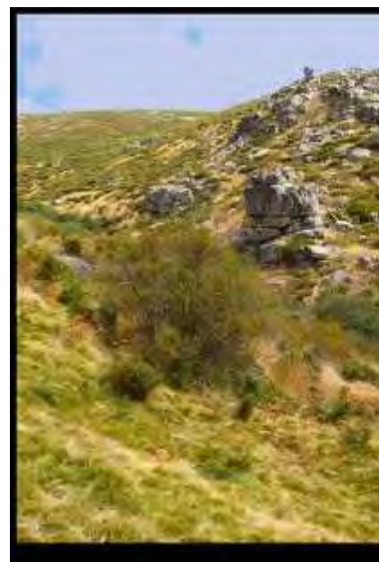
Sierra del Valle del Corneja

La ruta que hoy vamos a realizar dentro del programa de La Facendera para 2010, discurre a lo largo de una pequeña serranía, cuyo enclave más significativo es la villa de El Mirón, famosa por el castillo de origen medieval, que queda a sus pies, denominado popularmente “Castillo de los Moros”, enclavado en la parte más alta de esta sierra, situada dentro de la Comarca de Piedrahita y protegiendo por el este, el valle del río Corneja, que da su nombre a varios municipios de la comarca.