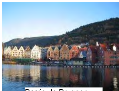
Barrio de Brvåen

ñas" fue Ludvig Holberg, considerado padre de la literatura danesa y noruega (1.684 – 1754 )inspirándose en las siete colinas de Roma. Bergen es la capital oficiosa de la región conocida como Noruega Occidental, y también se la conoce y promociona como la puerta de entrada a los famosos fiordos noruegos. Además, el puerto también es por mucho el mayor de Noruega: gestionó más del 50% de mercancías por vía marítima en Noruega en 2005.