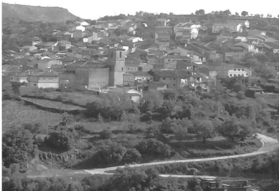
San Esteban de la Sierra