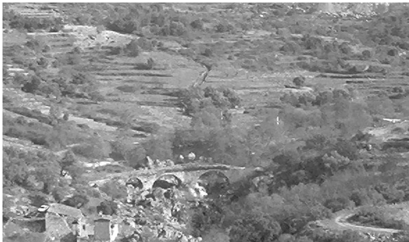
El Puente sobre el Alagón