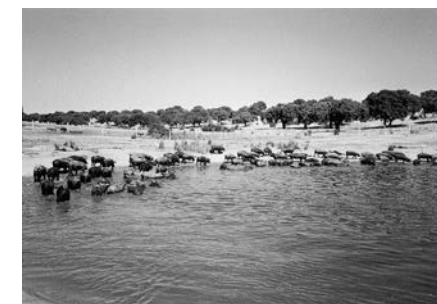
Ganadería en Espeja