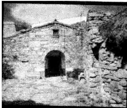
Casa de Cillero

hidráulicos en la rivera y en el cauce del río Tormes y 5 aceñas en su término municipal que hoy día se encuentran bajo las aguas del pantano de "LA ALMENDRA" al igual que los 8 molinos de los 16 de la rivera.