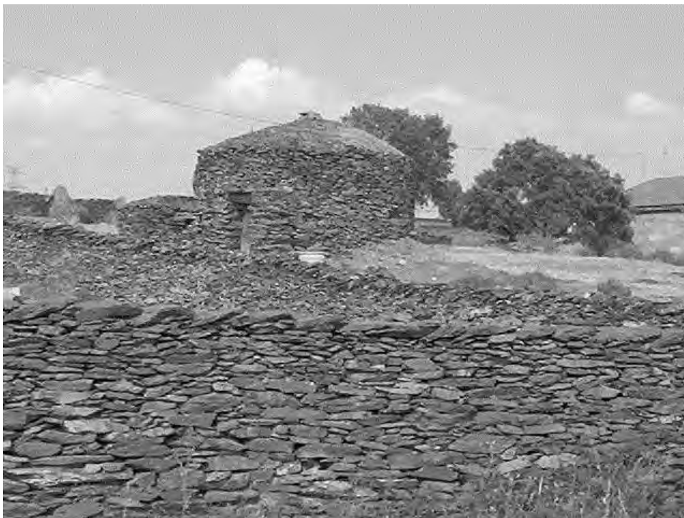
Chozo de pastores