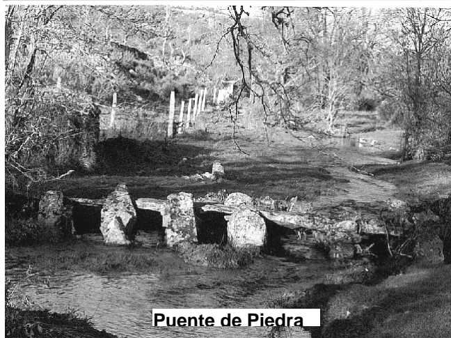
Puente de Piedra